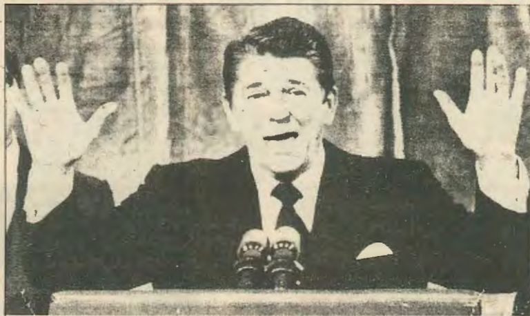
«Τα βάσανα σας τέλειωσαν τώρα!» Απο τις εξαγγελίες του φαίνεται ότι τώρα αρχίζουν

Αυτοί που μπήκαν στον κόπο ψήφισαν να φύγει ο Κάρτερ